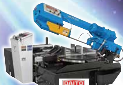
DAITO 大東精機(株) LTA300