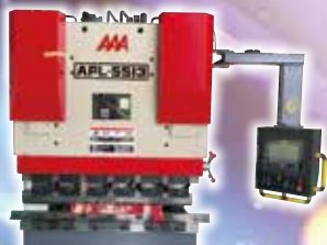
AAA 相澤鐵工所 (株)相澤鐵行所 CNCプレス ブレーキ APL-5513RaS