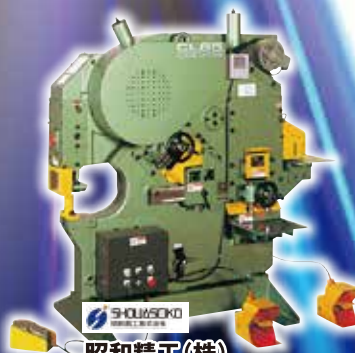
SHOUSOKEI 昭和精工(株) パネル出品