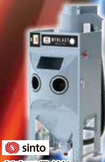
sinto 新東工業(株) エアブラスト MY-30B