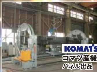
KOMATSU ヨマツ産機(株) パネル出品