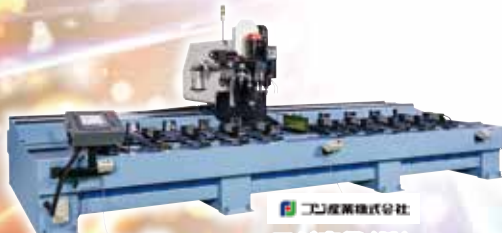
フジ産業(株) 長尺加工機 FB-5000-20ATC-S