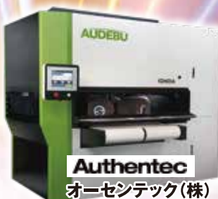
Authentec オーセンテック(株) バリ取り機 ●IGNOIA ●Black Line650 ●Racoon1000