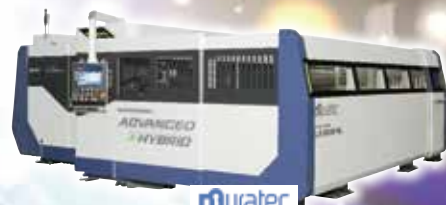
muratec 村田機械(株) パネル出品