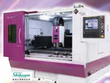
Shibuya 澁谷工業(株) ファイバーレーザー 加工機 SPF4112