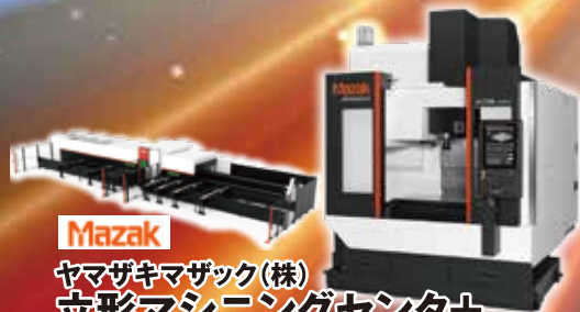
Mazak ヤマザキマザック(株) 立形マシニングセンタ+ 大型サンプルワーク、実演加工動画 VCN460-FG400NEO