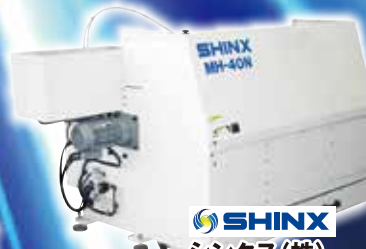
SHINX シンクス(株) H鋼開先機 MH-40N