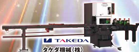
TAKEDA タケダ機械(株) UWD-45III