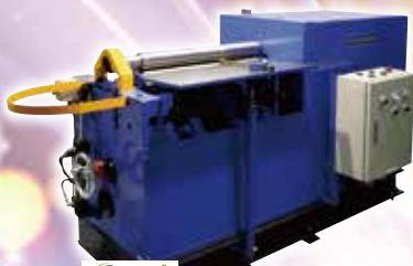
isel (株)アイセル ロールベンダー BUSK-1300