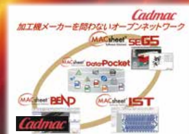
Cadmac (株)キャドマック CAD/CAM ソフト多数