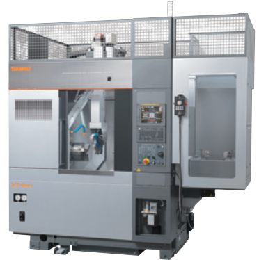
8インチ CNC精密旋盤 XT-8MY