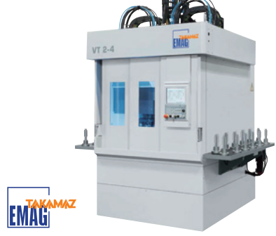
TAKAMAZ EMAG TAKAMAZ EMAG (ドイツ) 立形シャフト加工旋盤 VT 2-4