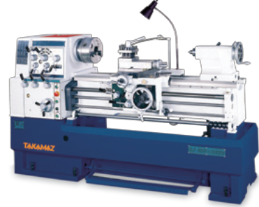
ECOCA ECOCA (台湾) 汎用旋盤 SJ460×1000G