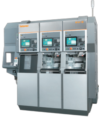
倒立形 CNC精密旋盤 XV-3